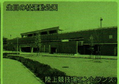
生目の杜運動公園