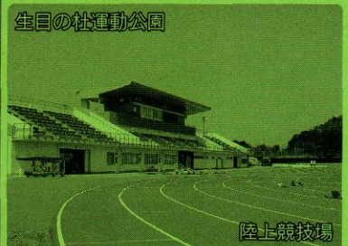
生目の杜運動公園